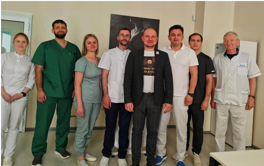
Лікарі онкоцентру на майстер-класі з лазерної проктології на базі Expertum Clinic