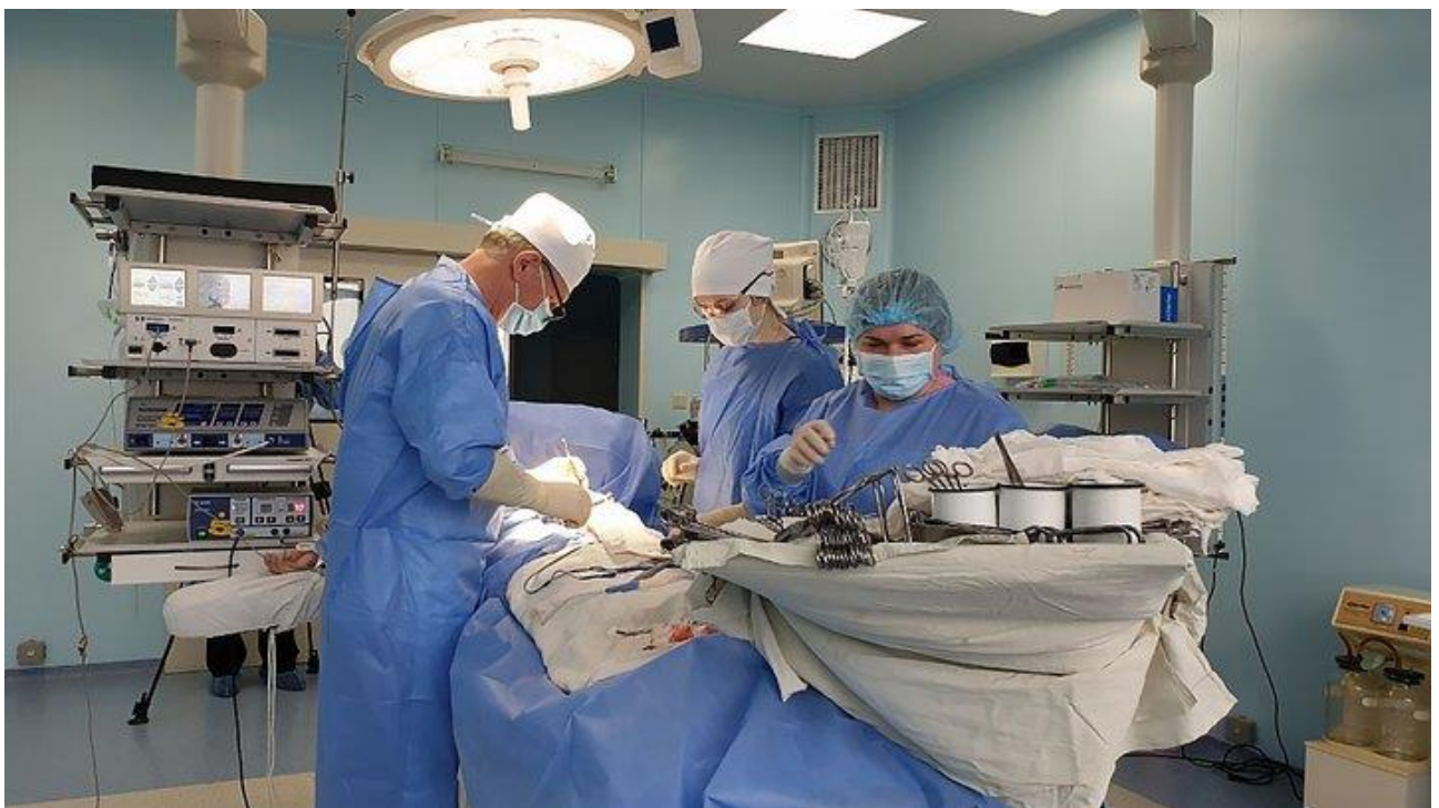
Операція з видалення частини товстої кишки