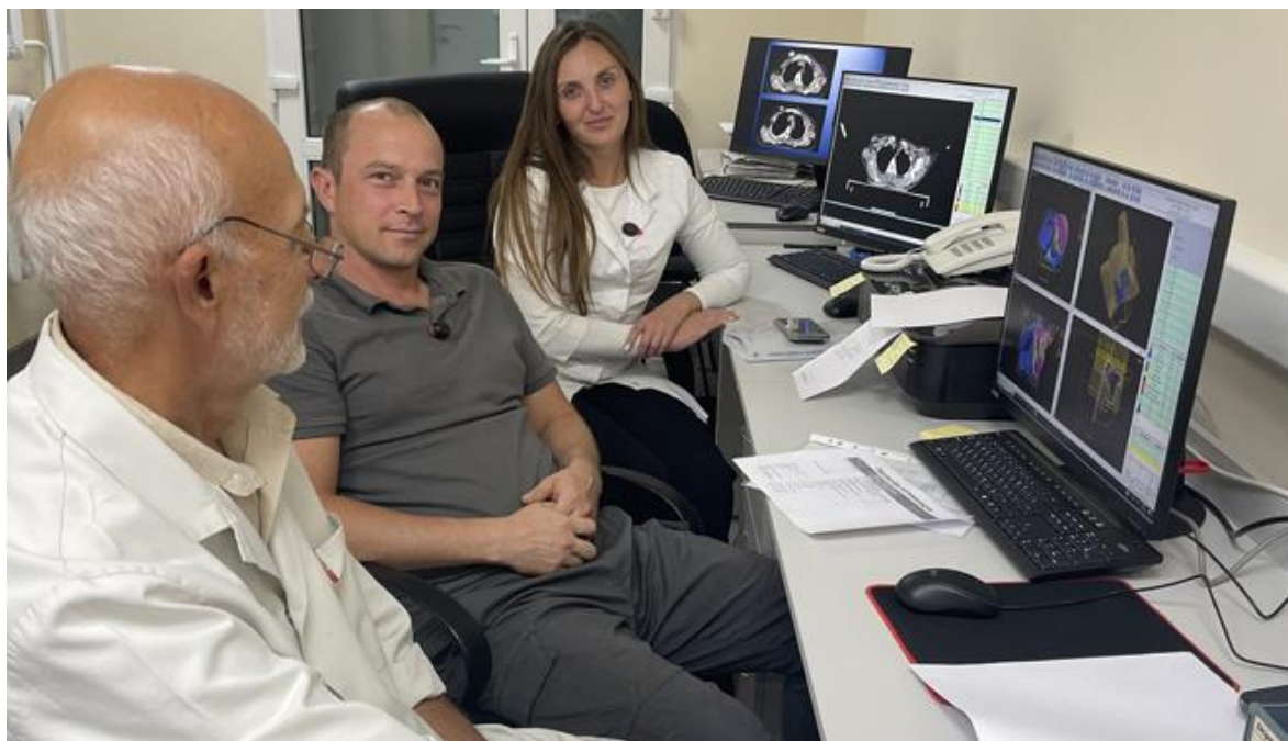
В онкологічному центрі введено в експлуатацію єдиний в Україні гамма-терапевтичний апарат TERABALT із коліimatorною насадкою