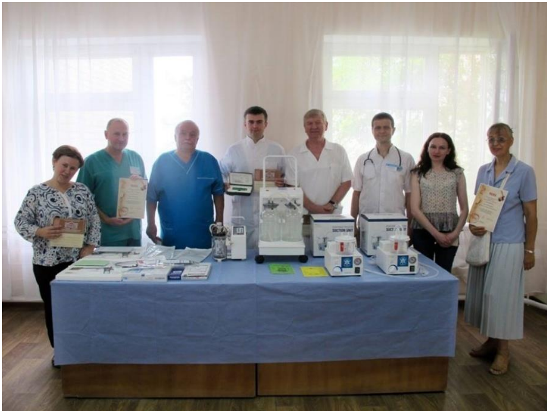
Передача обладнання для обласного онкологічного диспансеру, яке було придбано за кошти, зібрані під час восьмого Великоднього благодійного аукціону