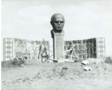
Фото пам'ятника 1990 року