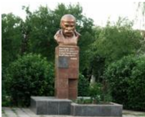
Монумент 1994 року