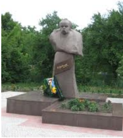
Монумент 2008 року

вкритий міддю, заввишки 1,5 метри. Постамент погруддя із залізобетону, обкладений полірованою гранітною плитою, заввишки 1,2 метри. На тілі постаменту рельєфними літерами з пластичного матеріалу нанесені віршовані слова поета: «Свою Україну любіть. Любіть її у время люте. В любую тяжкую минуту за неї Господа моліть». 2008 року через руйнацію відбулась заміна існуючого пам'ятника на новий. Скульптор – О.Рожик. Пам'ятник виготовлено ПП «Тендер» (с.Балаклея, Смілянський р-н, Черкаська обл.). Це погруддя з сірого граніту асиметричної форми, що стоїть на колоні, яка виконує функцію постаменту. На тілі постаменту встановлена табличка з граніту коричневого кольору, на якій нанесено позолотою факсиміле Т. Г. Шевченка. Заввишки погруддя – 1,5 метри, колона постаменту – 2,5 метри.