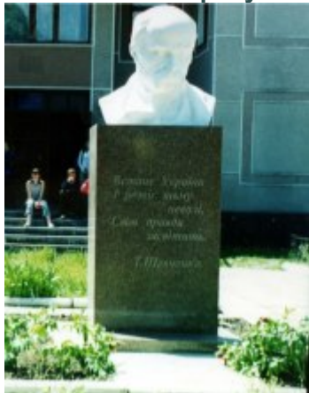
Сучасний вигляд пам'ятника

році пам'ятник передано селищу. Було вирішено встановити його в межах центрального майдану біля районного відділення казначейства. Було виготовлено новий постамент і викарбовано слова Кобзаря: "Встане Україна і розвіє тьму неволі, світ правди засвітить". Погруддя Т.Шевченка виготовлено з гіпсу.