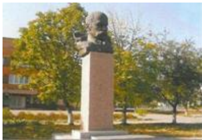
Пам'ятник, встановлений у 1988 році

Розміщений на проспекті Леніна поряд з гімназією № 1 імені Т. Г. Шевченка в м.Олександрія. Встановлений у 1988 році. У 2000-них рр. бюст було замінено, оскільки попередній почав руйнуватись під впливом погодних чинників.