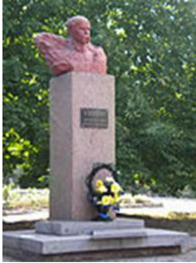
Оновлене погруддя на поч. XXI ст.