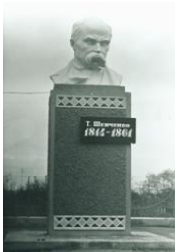
Фото 1983 року