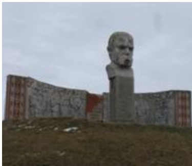
Сучасний вигляд пам'ятника

Пам'ятник Т.Г.Шевченку у селі Попельнастому Олександрійського району Кіровоградської області був створений за проектом скульпторів Ю. Сунгурова і Л. Раченка. Пам'ятник розташований на штучному насипаному кургані-могилі поблизу сільського клубу, до якого веде широка алея обсаджена блакитними ялинами та туями. Пам'ятник було відкрито у 1990 році. Виготовлення та встановлення здійснено за кошти колгоспу ім.Т.Г.Шевченка. Історія створення – в зв'язку з тим, що колгосп носив ім'я Т.Г.Шевченка, рішенням виконкому сільської Ради встановлено бюст Кобзареві.