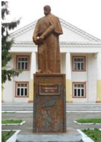
Сучасний вигляд пам'ятника