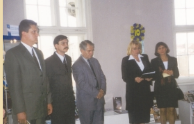
відкриття виставки «Україна: вчора, сьогодні, завжди!»

Шостий розділ — «Культура України: метафори буття» — найбільший, бо, як правило, вона — найдовговічніша, а наш земляк, останній у ХХ столітті український філософ, чие ім'я носить і наша бібліотека, Дмитро Чижевський вважав, що культурні зв'язки більше зближують народи, аніж політичні. Це — альбоми «Дух України: 500-ліття малярства», виданий у Канаді,