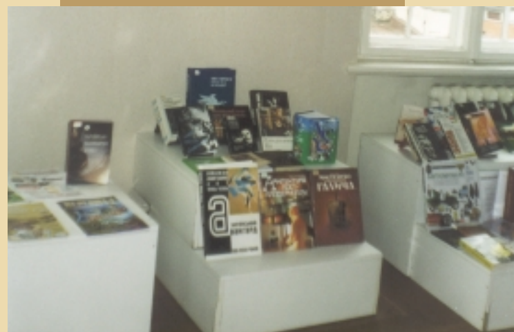
розділ «Культура України: метафори буття»