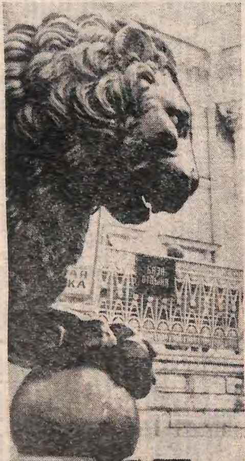
Гострослови, на старт!