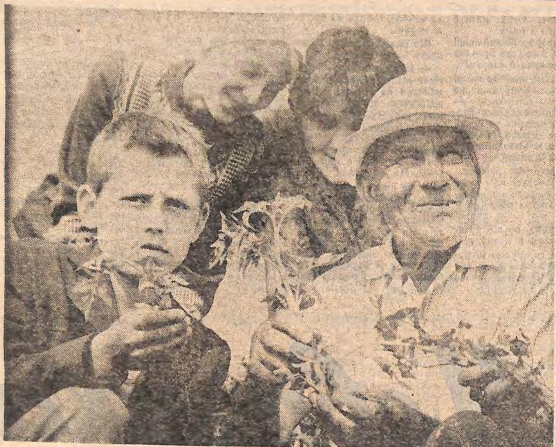
Цікаве літо у школярів Трєпівської десятирічки Знамянського району: це і догляд городини у колгоспі, і конкурс (наприклад, на визначення «Місця художніх творів»)