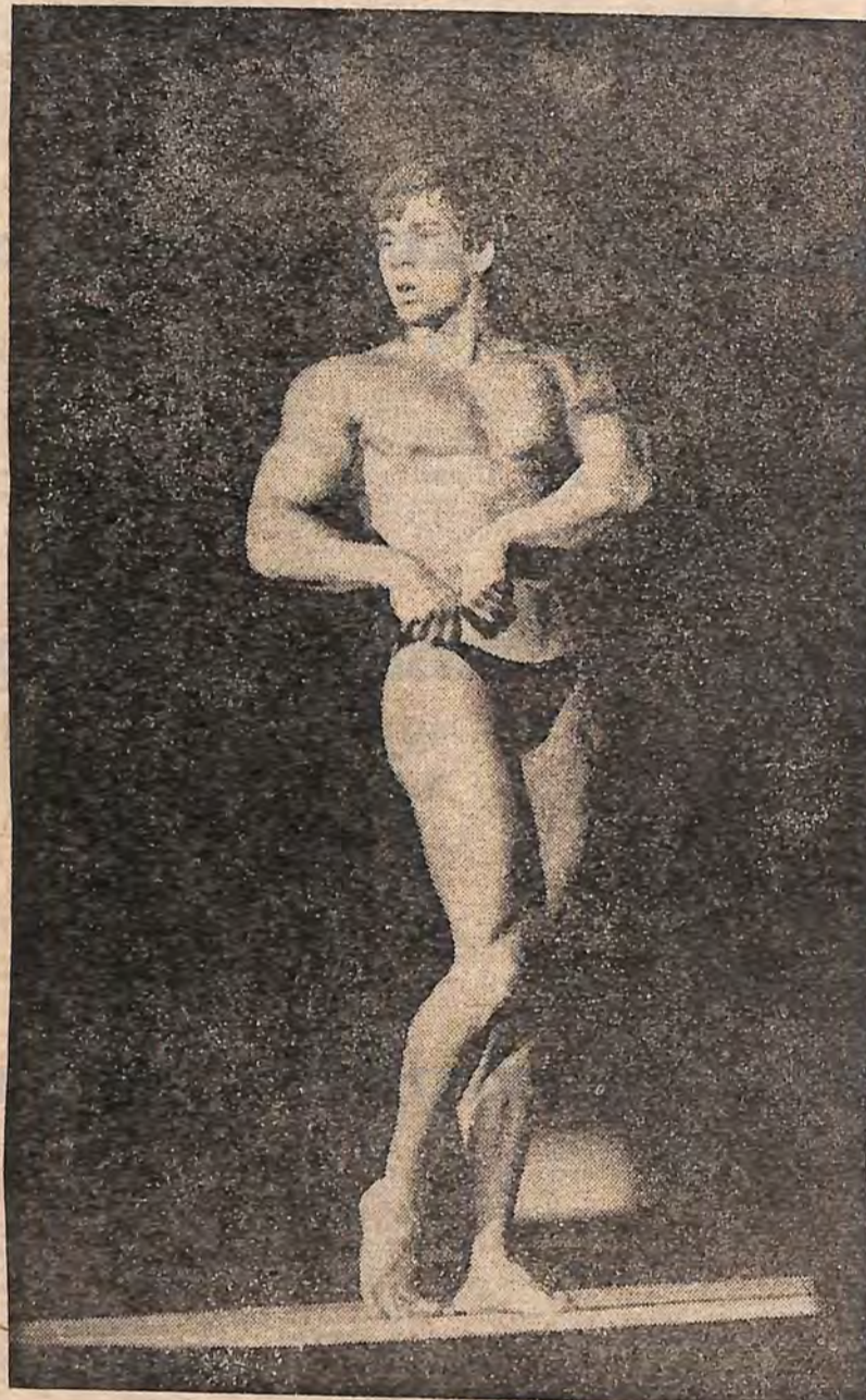
Атлетична гімнастика —

ПОНАД 32 ОЧКИ. Стан дуже серйозний. Треба звернутися до лікаря, негайно позбутися шкідливих звичок і приступити до поступового тренування серцево-м'язів.