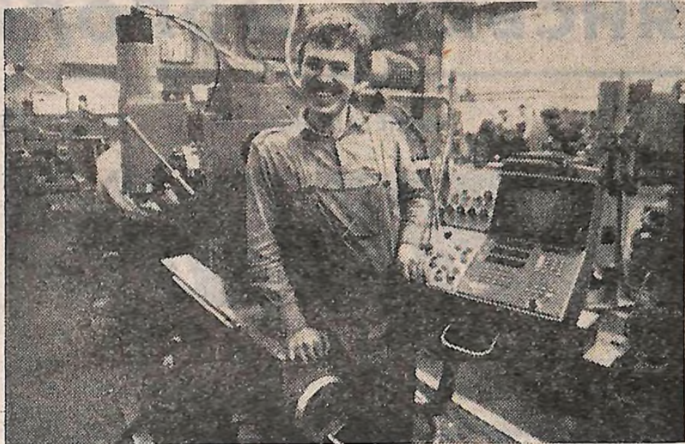
Литовська РСР. Колектив Вільнюського станнобудівельного заводу «Комунарс» з початку дванадцятипятиріччя повністю перейшов на випуск універсальних фрезерних верстатів з ЧПУ. З початку року випущено близько 50 верстатів понад завдання.