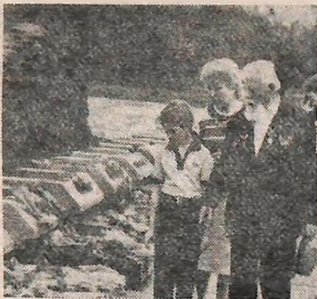
Люди всіх поколінь приходять по-клонитися руїнам Брестської фортеці.

(З Політичної доповіді ЦК КПРС XXVII з'їз- дові КПРС).