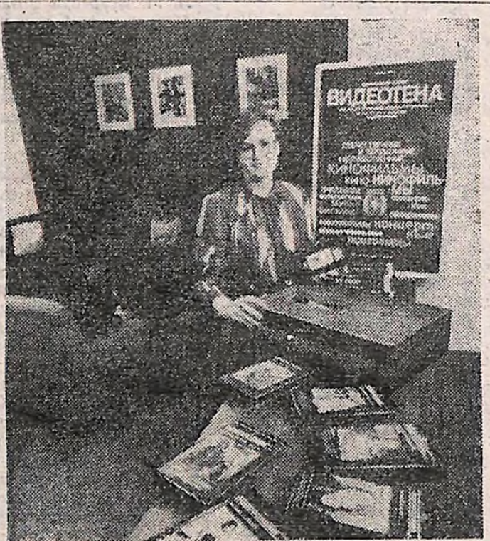
Вороньська відеотека була створена однією з перших у нашій країні. Зараз до послуг відвідувачів тут представлено більше півтори тисячі фільмів і програм. Відеомагнітофони, які випускає Вороньське виробниче об'єднання «Електроніка», забезпечують високу якість кольорового зображення.