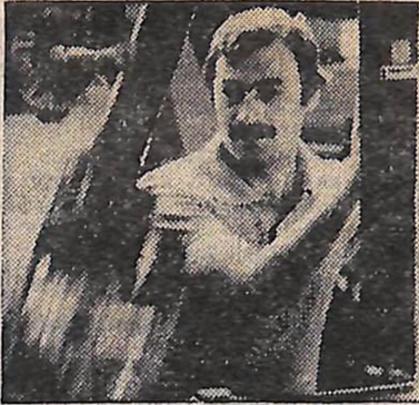
У нашій країні всі професії почесні. Про те, як береже робітничу честь молоді кировоградського заводу «Гідросила», читайте на 1-й стор.