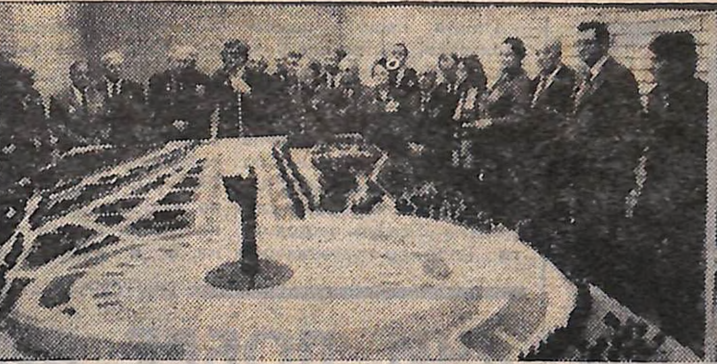
Спеціалісти Мінмонтажспецбуду СРСР — учасники будівництва пам'ятника Перемоги в Москві — слухають народного художника РРФСР Ю. Л. ЧЕРНОВА, який розповідає їм про ансамбль меморіалу. (Добірку по Вахті пам'яті читайте на 2-й стор.)