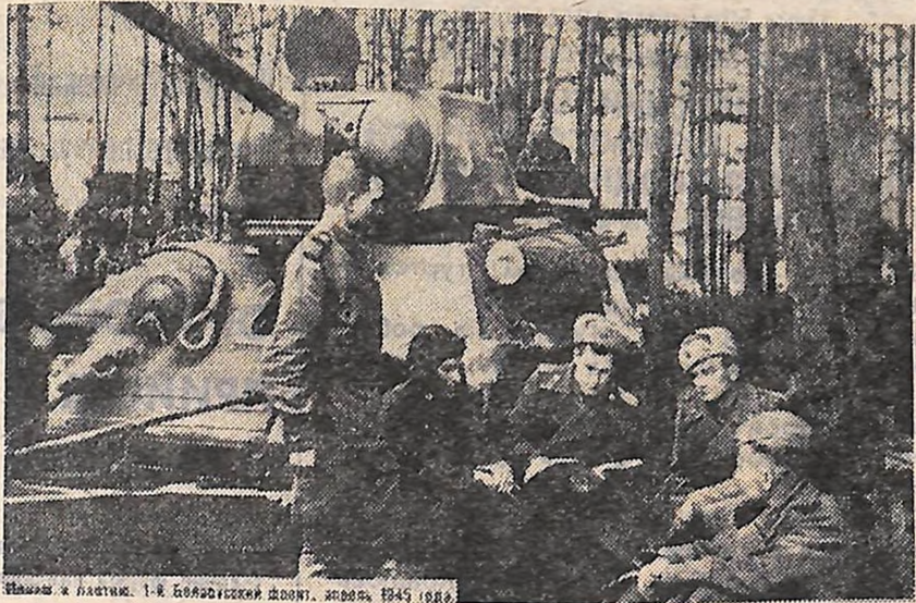
Молодий комунар. 1-й номер. 1945 рік.

Озброєна марксистсько-ленінською теорією, володіючи величезним досвідом керівництва країною, партія мобілізувала народ на кінцевий розгром ворога. На початку 1945 року в парторганізаціях Радянської Армії і Флоту стояли на обліку 3325 тисяч комуністів, або майже 60 процентів від загальної кількості членів і кандидатів у члени ВКП(б).