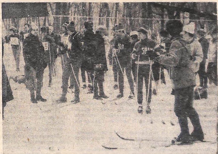
У колективах фізкультури нині тривають змагання за програмою Тижня лижника. На старті вийшли школярі, робітники підприємств, спортивні сім'ї. На знімку: лижники Світловодська в парку культури та відпочинку імені Т. Г. Шевченка.

У багатьох турнірах брали участь юні кіровоградці. Особливо «врожайним» для них став минулий рік. У березні відбулося зма-