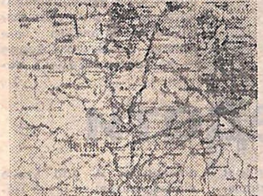
Матеріали, присвячені 40-річчю Великої Перемоги читайте на 1-й і 2-й стор.