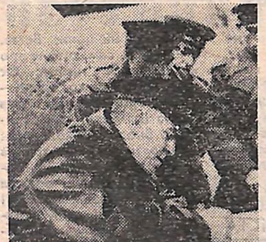
Маршал Советского Союза Г. К. Жуков.