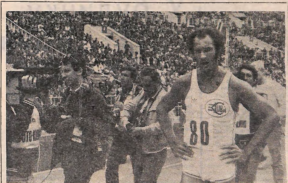
МІЖНАРОДНІ ЗМАГАННЯ ЛЕГКОАТЛЕТІВ «ДРУЖБА-84» Москва. Дворазовий олімпійський чемпіон кубинець Альберто ХУАНТОРЕНА (на знімку після фінішу) переможно завершив свої виступи у великому спорті, вигравши на стадіоні в Лужниках фінал бігу на 800 метрів — 1.45,68 сек.

Н. ДОБРІН, лауреат обласної журналістської премії імені Ю. Яновського.