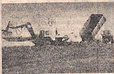
«Тваринництво — ударний фронт» — сьогодні немає потреби переконувати в цьому молодих кормозаготівельників області (1 сторінка).