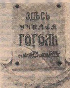
Минає 175 років з дня народження М. В. Гоголя (3 стор.).