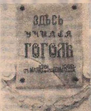
Минає 175 років з дня народження М. В. Гоголя (3 стор.).