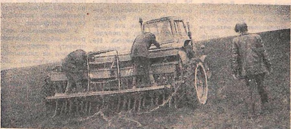
Ранок. Прохолодна блакить весняного неба, дружний гуркіт потужних тракторів. Пробуджений після зимової сплячки степ розкинув широкі крила далешніх гір...

Отак і перезимували. З приходом весни штат знову побільшав, стало веселіше. Щодня приходили все нові й нові. Декого вже й забувати почали, а він, дивись, не розраховувався, повернувся на своє робоче місце.