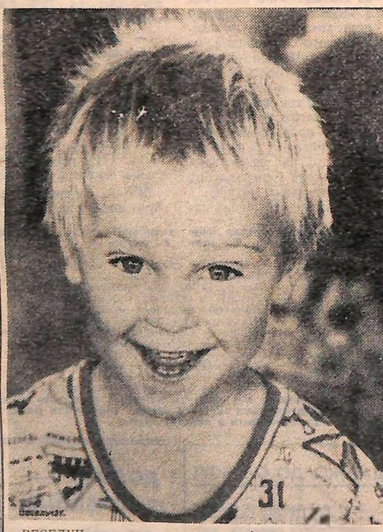
ВЕСЕЛУН.