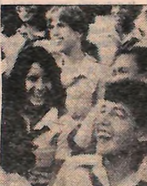
Сміх — це також здоров'я.

Періодичний матеріал друкується на 4 стор.