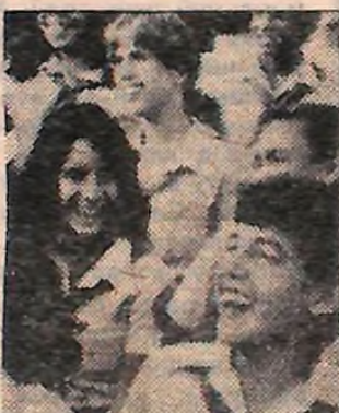
Сміх — це також здоров'я.

Періодичний матеріал друкується на 4 стор.