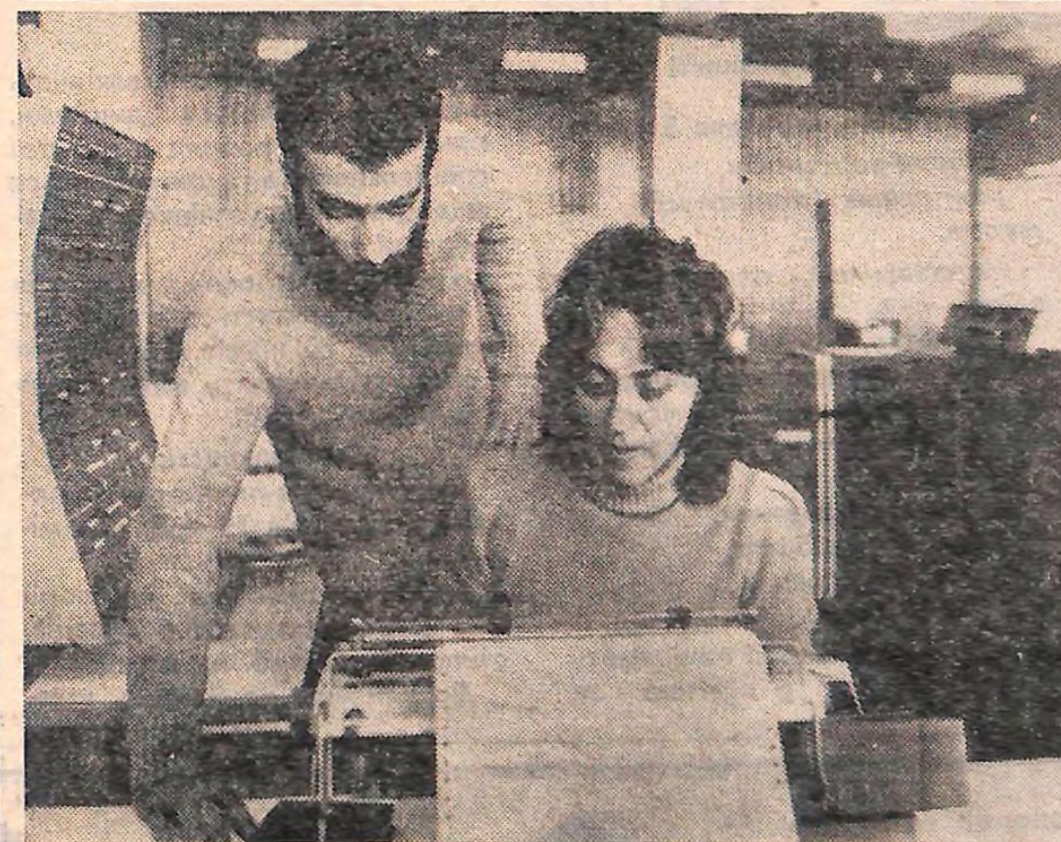
БОЛГАРІЯ. Великий багаж не тільки теоретичних, а й практичних знань, що дозволяють молодому спеціалісту з першого дня активно включитись в напружений ритм сучасного виробництва, — такі риси вирізняють випускників Вищого машино-електротехнічного інституту імені В. І. Леніна в Софії. Набути цих якостей у період навчання допомагає відділення навчально-виробничої діяльності під назвою «студентський загон», яке уже кілька років діє при інституті. На знімку: учні студентськокурсники в інформаційному обчислювальному центрі «студентського заводу».

Машинобудівний технікум. Під час третього трудового семестру в області працюватиме чотири сільгосзагони і один будівельний загін технікуму. Паралельно з їх формуванням проводиться заліз у бригади мулярів і штукатурів, які літніми літом будуть працювати на будівництві гуртожитку цього навчального закладу.