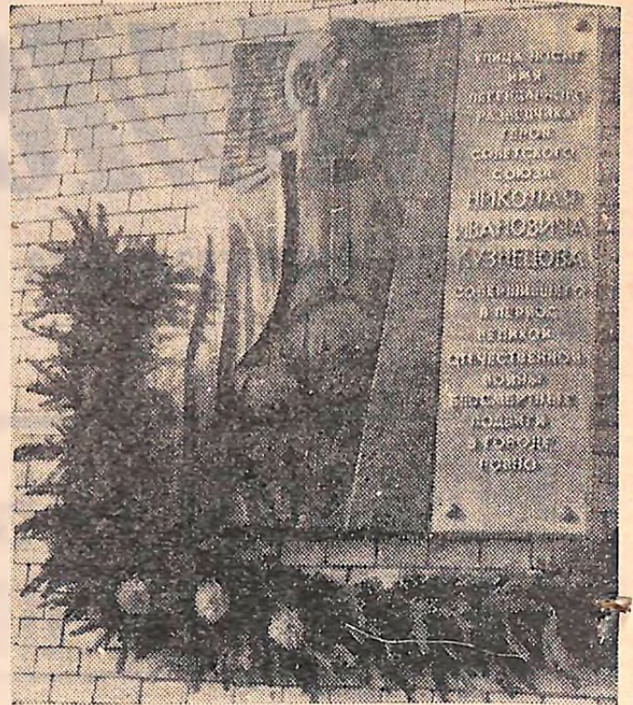
УКРАЇНСЬКА РСР. У роки Великої Вітчизняної війни у Ровно, в глибокому тилу ворога діяв радянський розвідник Микола Кузнецов.

На Україні свято шанують пам'ять радянського патріота Героя Радянського Союзу. Іменем Кузнецова у Ровно названі площа, вулиця, школа. Йому споруджено пам'ятник, на місці львочині квартири розвідника діє меморіальний музей М. І. Кузнецова. Про подвиги героя написано багато книг, складені вірші, пісні. А неподалік від споруджуваної в області Ровенської АЕС виникло нове місто — Кузнецовськ.