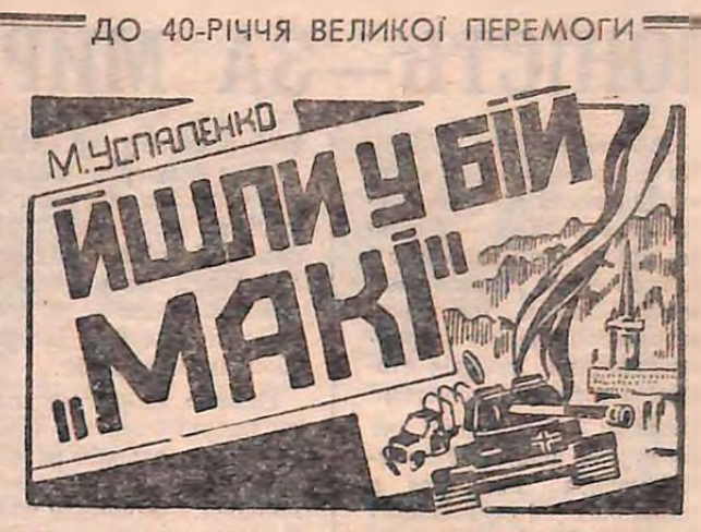
(Продовження. Поч. у №№ 15, 17)