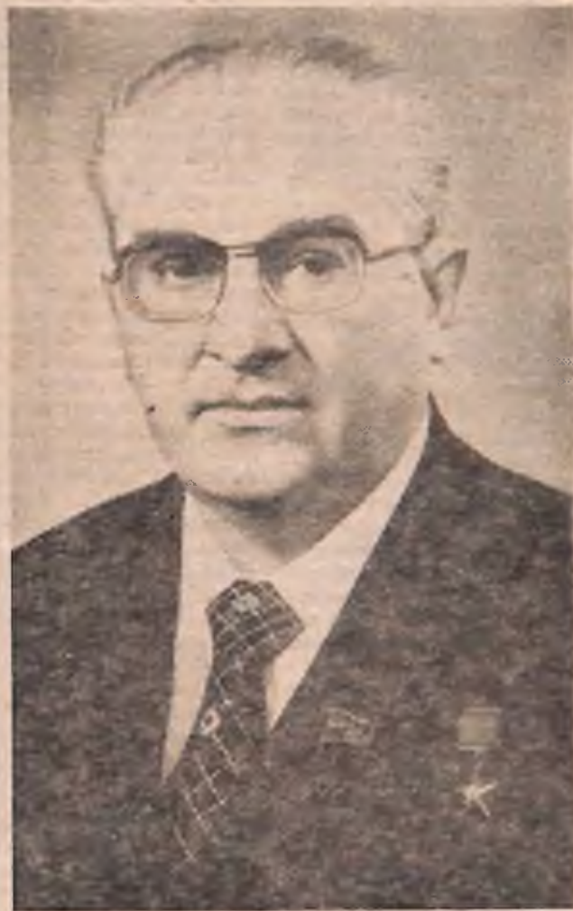
ВІД ЦЕНТРАЛЬНОГО КОМІТЕТУ КОМУНІСТИЧНОЇ ПАРТІЇ РАДЯНСЬКОГО СОЮЗУ, ПРЕЗИДІЇ ВЕРХОВНОЇ РАДИ СРСР, РАДИ МІНІСТРІВ СРСР

Центральний Комітет Комуністичної партії Радянського Союзу, Президія Верховної Ради СРСР, Рада Міністрів СРСР висловлюють глибоку впевненість у тому, що комуністи, всі радянські люди з новою силою виявлять свою класову свідомість і організованість, свої високі колективістські якості, цілеспрямованою самовідданою працею забезпечать виконання народногосподарських планів і соціалістичних зобов'язань, дальший розквіт нашої великої Батьківщини.