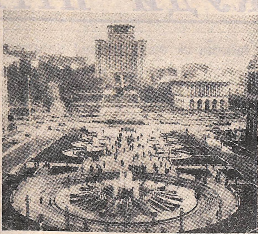
На знімку: площа Жовтневої революції.

С. КАРЛАШ, завідуючий фондами музею обкому комсомолу.