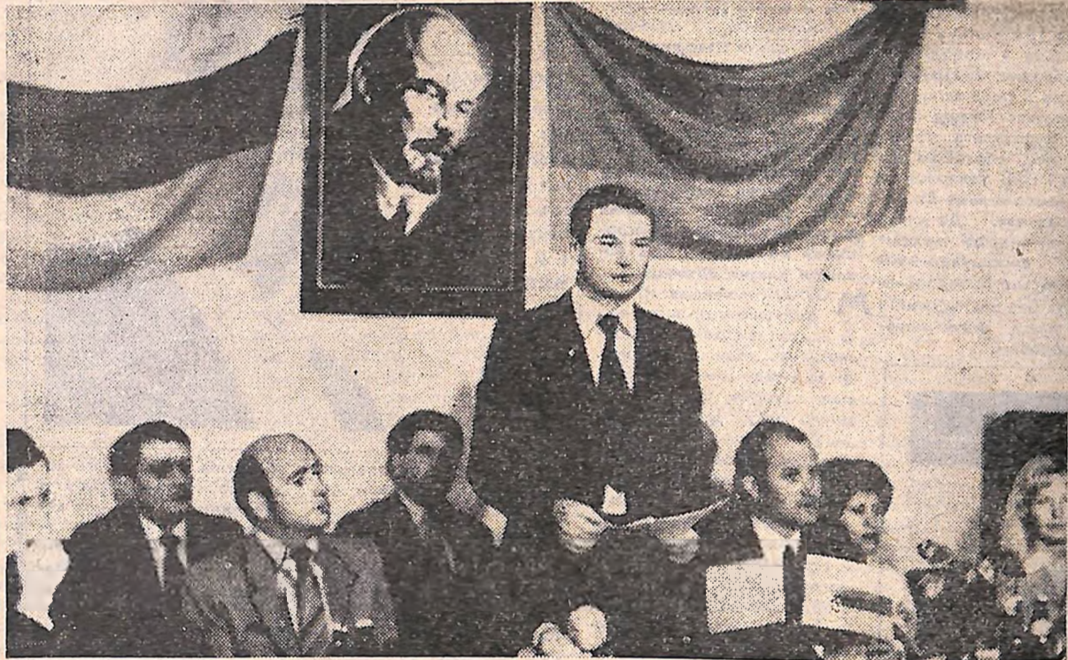
Іде засідання міжнародного клубу молодих механізаторів «Кіровоград—Толбухін».