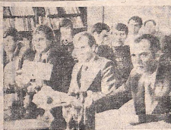
У залі засідання клубу «Кіровоград—Толбухін».