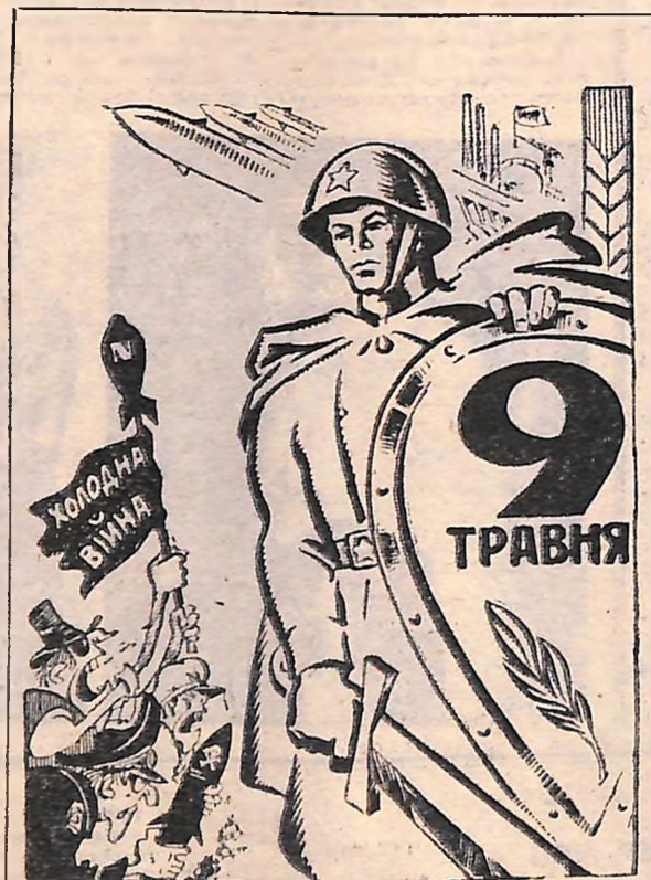
Паліям війни цю дату слід добряче пам'ятати! Мал. В. ПЕТРЕНКА.

Іван Васильович Панфілов командував 316-ю стрілецькою дивізією, яка 17 днів стримувала фашистські полчища, що проривалися до Москви. Про легендарний подвиг панфіловців знає весь світ. Сорокавосямиріччя і нині командир загинув смертю героя 13 листопада 1941 року. Родом він із села Петровського Саратовської губернії. А пам'ятник йому встановлено на вході в центральний парк м. Фрунзе, що носить його ім'я. Перший пам'ятник героєві Великої Вітчизняної.