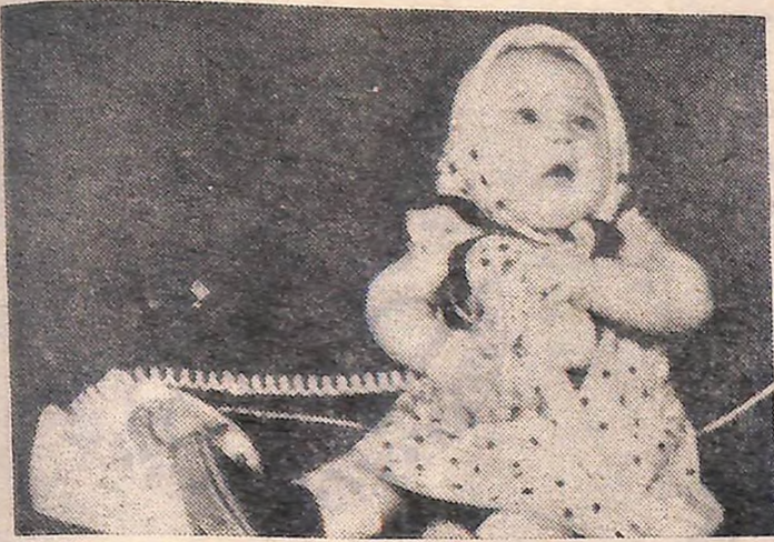
«ОЙ І КЛОПІТ З ЦИМ ТЕЛЕФО- НОМ...»