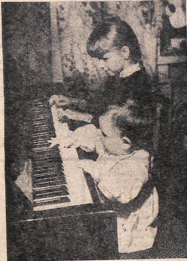
У ЧОТИРИ РУКИ...