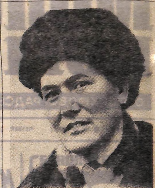
Один з наймолодших членів башкирської делегації, яка нещодавно побувала на Кіровоградщині, — чабан радгоспу Хайбуллинського району БАРСР, Герой Соціалістичної Праці, депутат Верховної Ради РРФСР С. С. КІЛЬДЕБАН.

Ансамбль — частий гість заводських фестивалів. Недавно з великим успіхом він виступив перед сільськими трудівниками Гафурійського та Аургазинського районів.