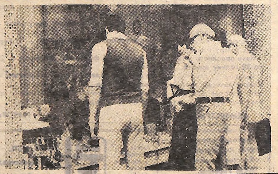
На знімку: роздуми біля вітрини магазину — знову зросли ціни.