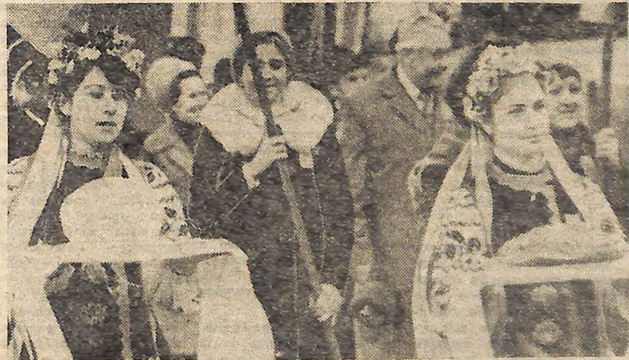
Жовтнева демонстрація на площі імені Кірова.