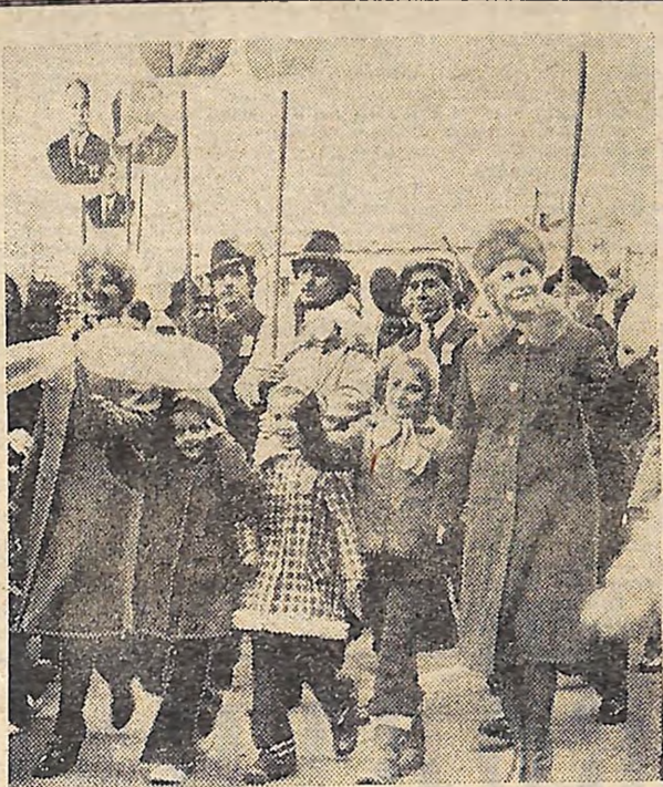
В колонах демонстрантів на площі Кірова.