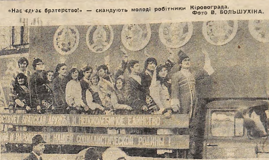
«Нас єднас братерство!» — скандують молоді робітники Кіровограда.