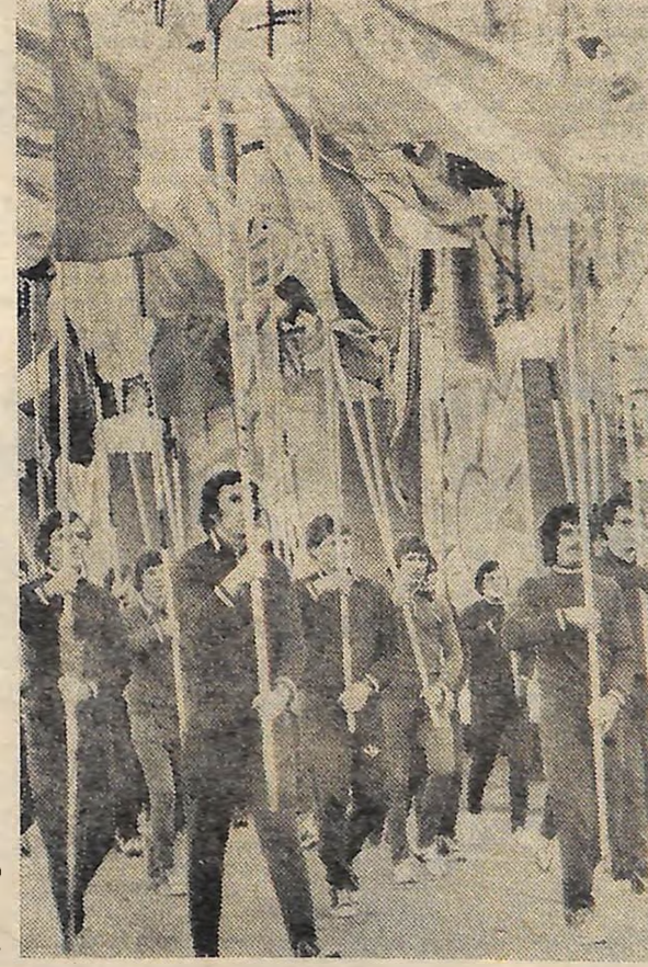
Йдуть спортсмени обласного центру.

На транспарантах, що їх несуть робітники ордена «Знак Пошани» заводу тракторних гідроагрегатів імені XXV з'їзду КПРС, — рапорти про виконання соціалістичних зобов'язань. За успіхи в трудовому суперництві колектив занесено на обласну Дошку пошани. Йдуть харчовики, будівельники, взуттєвики, працівники торгівлі, зв'язку, працівники обласних і міських організацій та установ, побутового обслуговування. Майорять над колонами прапори. Кінцякраю немає святковим шеренгам, квітнуть тисячами усмішок вулиці міста. А над усім — палає червоний прапор Жовтня. Нам випало щастя нести його далі.