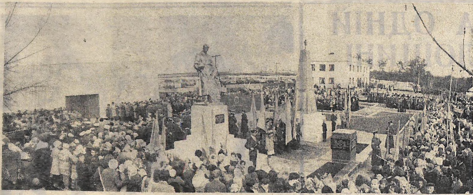
УРОЧИСТИЙ МІТИНГ ВІЛЯ МУЗЕЮ КОМСОМОЛЬСЬКОЇ ПІДПІЛЬНОЇ ОРГАНІЗАЦІЇ «СПАРТАК».