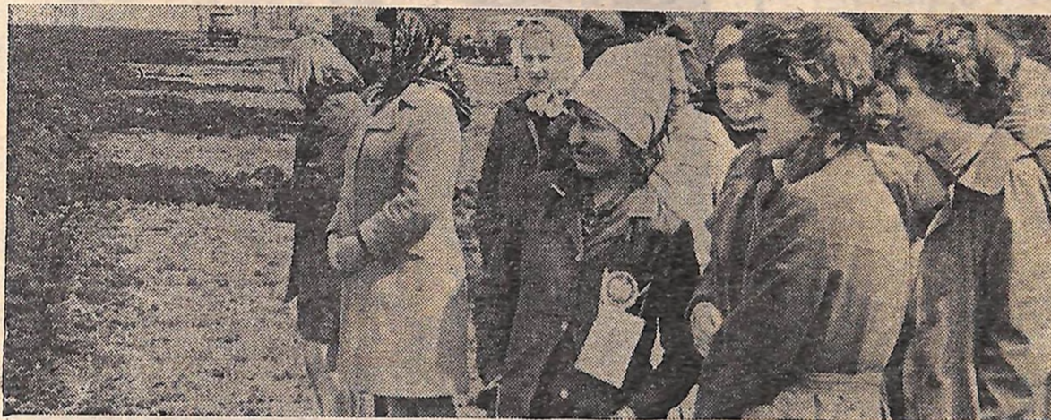
На фото: під час змагання юних орців.

Інформаційно-методичний центр обкому комсомолу.