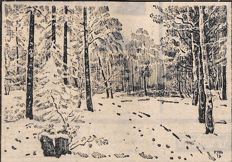
Перший сніг. І перший іній... У задумі ліс дрима. Це прийшла чарівниця-зима У малюнку назвовому ліній.

учениця 9 класу Богданівської середньої школи № 2, лісничка шкільного лісництва ім. Синова. Знам'янський район.