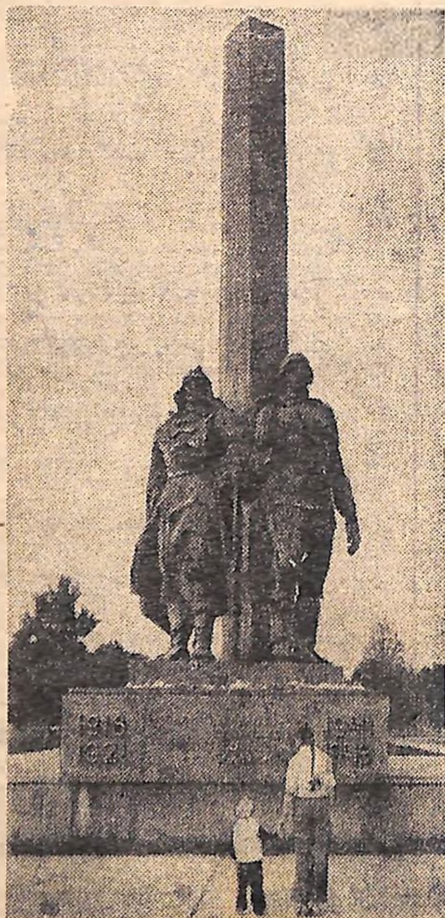
На фото: обеліск Слави героям громадянської і Великої Вітчизняної воєн в м. Кіровограді.

В. КРАМАРЕНКО, відповідальний секретар управління обласної організації Українського товариства охорони пам'яток історії та культури.