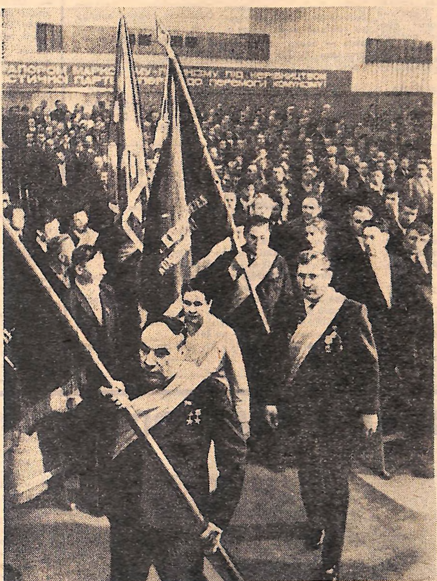
НА ФОТО: УРОЧИСТЕ ВІДКРИТТЯ МІТИНГУ.

25 СЕРПНЯ У БУДИНКУ ПОЛІТОСВІТИ ОБКОМУ ПАРТІЇ ВІДБУВСЯ МІТИНГ ПРЕДСТАВНИКІВ КОЛЕКТИВІВ ТРУДЯЩИХ З НАГОДИ ПРИВІТАНЬ ГЕНЕРАЛЬНОГО СЕКРЕТАРЯ ЦК КПРС, ГОЛОВИ ПРЕЗІДІЇ ВЕРХОВНОЇ РАДИ СРСР ТОВАРИША Л. І. БРЕЖНЄВА, ЦК КОМПАРТІЇ УКРАЇНИ І УРЯДУ РЕСПУБЛІКИ У ЗВ'ЯЗКУ З ВИКОНАННЯМ ОБЛАСНОЮ СОЦІАЛІСТИЧНИХ ЗОБОВ'ЯЗАНЬ ПО ПРОДАЖУ ХЛІБА ДЕРЖАВІ.