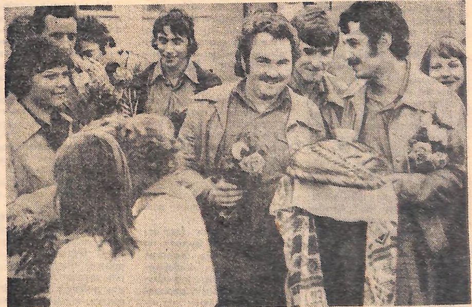
НА ФОТО: НОВОУКРАЇНСЬКА ЗЕМЛЯ ВІТАЄ ГОСТЕЙ ХЛІБОМ-СІЛЛОМ.

— Ми перебуваємо на українській землі більше чотирьох тижнів. За цей