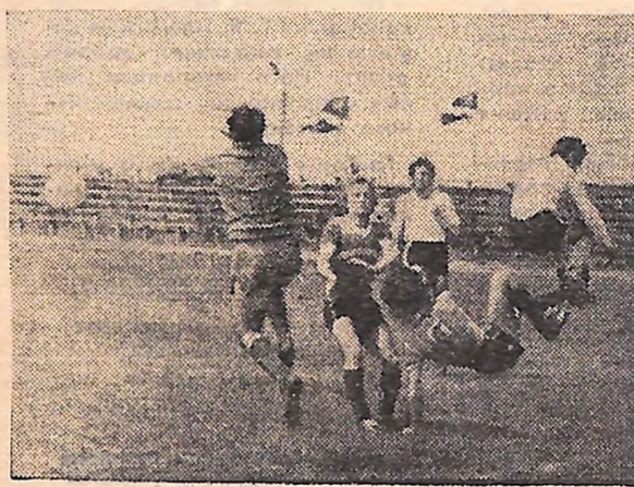
НА ФОТО: МОМЕНТ ЗУСТРІЧІ КІРОВОГРАДЦІВ І МИКОЛАЇЗЦІВ.