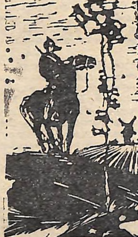
Це Ленїна голос Майбутнє збудув!

В обличчя епохи зїркіше вдивись! У зливих нестримних Жовтневих знамен Звїтлягу нестиме Небачений день. Крізь далі і хмари, Крізь весен розгїн, Вдивись, комісарє: Промїніться він! Промїніться чистий, Як совість і честь. Це йдуть комуністи Плече у плече. Це в грізних загравах Злий морок дола Іллі в перших лавах, Попереду лав. Земля розколотась Під кроком полків.