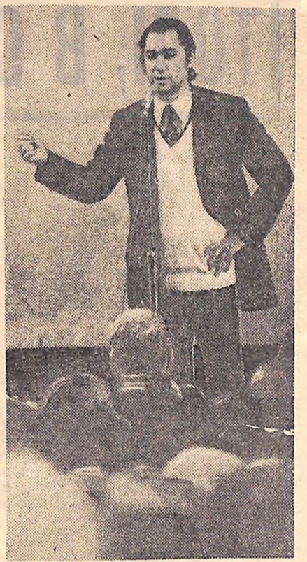
Нещодавно в гостях у кіровоградців побував відомий актор Володимир Короткий. Глядачі пам'ятають його дебют у кінофільмі «Людина — амфібія» (тричі відзначений на міжнародних фестивалях, він демонструвався в 96 країнах світу). Відомі актор створив яскраві образи в багатьох спектаклях Московського драматичного театру імені К. С. Станіславського і в таких картинах як «Діти Дон-Кіхота», «Багато галасу даремно», «Визволення». Перед прем'єрою фільму «Переможець» у кінотеатрі «Комсомолец», в якому артист зайнятий в одній з головних ролей. В. Короткий зустрівся з глядачами. (На фото). Володимир Короткий побував також у Знаменці та Олександрії.

Тільки в цьому навчальному році з 208 фізкультурників школи 138 стали значківцями, 98 розрядниками. Десятикласник Вячеслав Цехоцький — чемпіон школи зі стрибків у довжину, штовхання ядра, семикласник Валерій Рахубовський — багаторазовий чемпіон з багатоборства ГПО. Ось результати десятикласника Вячеслава Зеленського: 100-метрову дистанцію він долає за 12,1 секунди, кілометровою — за 3 хвилини 2 се-