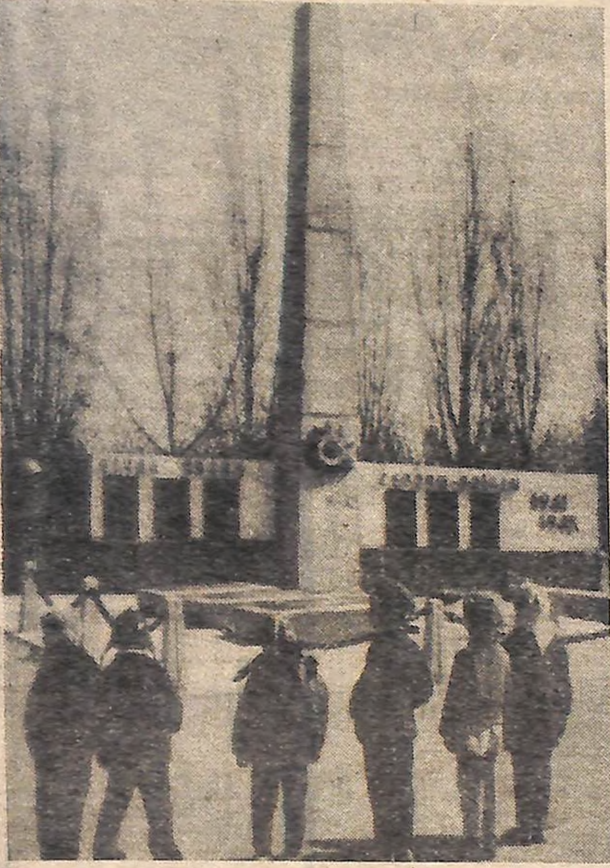
ОБЕЛІСК ВОІНАМ-ВИЗВОЛИТЕЛЯМ В СЕЛІ ШАСЛИВОМУ ОЛЕКСАНДРІЙСЬКОГО РАЙОНУ.