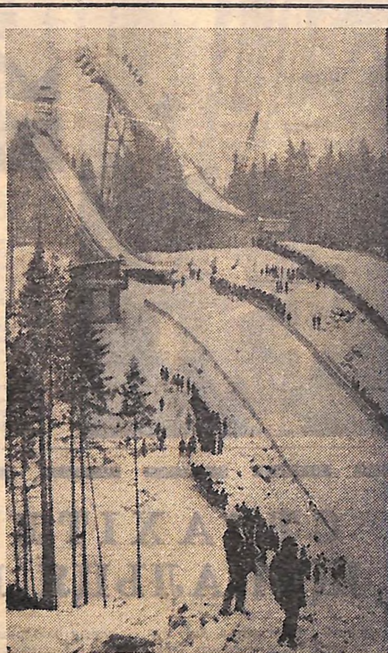
● ФОТОІНФОРМАЦІЯ ●

Отже, рахунок золотих нагород у збірній СРСР зріс до десяти.