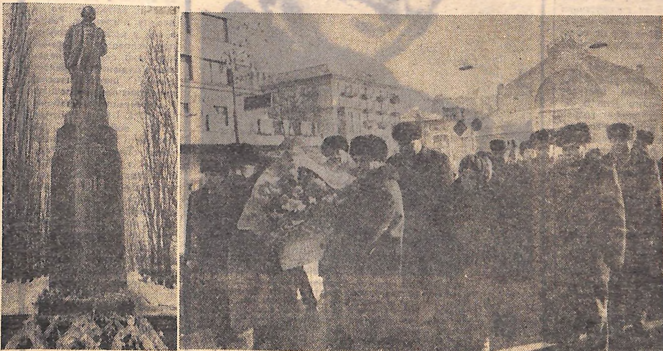
КІЇВ. 8 ЛЮТОГО 1976 РОКУ. ДЕЛЕГАТИ XXV З'ЇЗДУ КОМУНІСТИЧНОЇ ПАРТІЇ УКРАЇНИ ПОКЛАДАЮТЬ КВІТИ ДО ПАМ'ЯТНИКА В. І. ЛЕНІНУ.