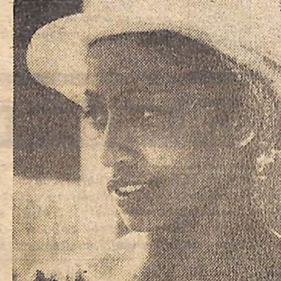
ЦЯ МОЛОДА КУБИНКА — БУДІВНИЦЯ СОЦІАЛІСТИЧНОЇ КУБИ (ФОТО СПРАВА).

Фото, яке ви бачите зліва — кадр з документального фільму. На ньому Фідель Кастро, Рауль Кастро, Каміло, Раміро Вальдес, Сіро Редондо та інші партизани виконують Національний гімн на вершині Туркіно. Коли тепер проїжджаєш по С'єра Маестро і бачиш новітні перетворення поля колишніх битв, розмовляєш з місцевими жителями, напам'ять приходять ті прекрасні нади, бо і до цього дня Фідель і його товариші, весь народ співали у цих горах, будуючи нове життя, кличуть до нових звершень.