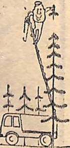
Мал. К. БРО.