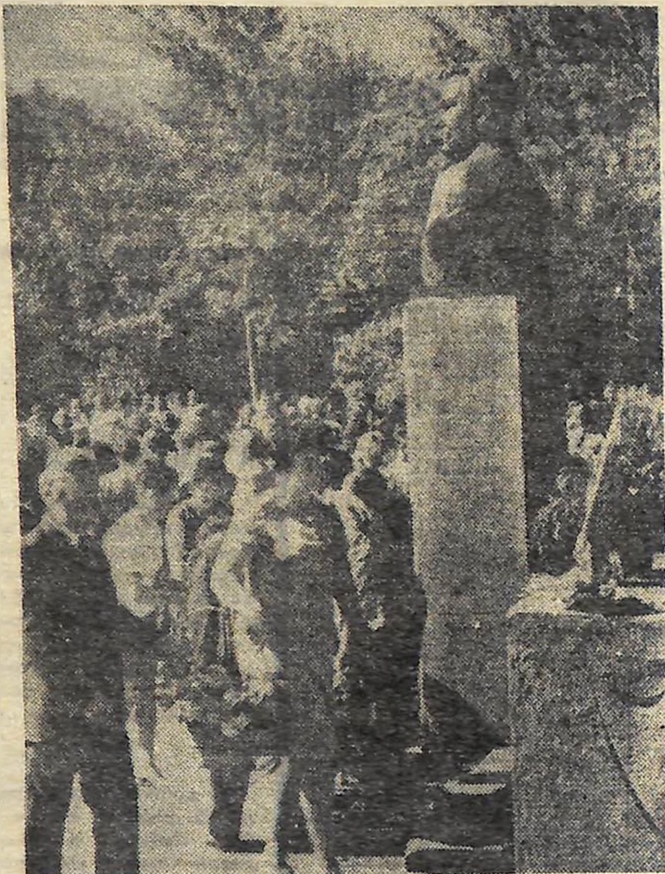
КВІТИ — ДО ПАМ'ЯТНИКА.

Перехідним призом імені Карпенка-Карого та дипломом І ступеня обласного управління культури нагороджено колектив Олександрійського самодіяльного народного театру за успішний показ п'єси К. Симонова «Ро-