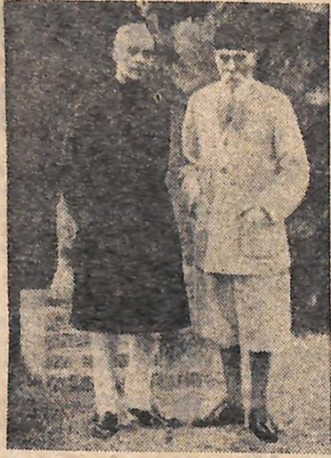
ДЖ. ПЕРУ І М. К. ПЕРІХ.

як героїчний реалізм. Мені радіє таке визначення. Подвиг, героїзм завжди були зовучими. Людство шукає подвигу, боротьби, страждає... Серце хоче пісні про прекрасне. Серце творить в труді, в шуканні вищої якості», — говорив Періх. І природно, що саме Періх напередодні другої світової війни став ініціатором заклику до урядів усіх держав світу укласти пакт про охорону історичних пам'яток, який знайшов гарячий відгук у великих гуманістів землі.