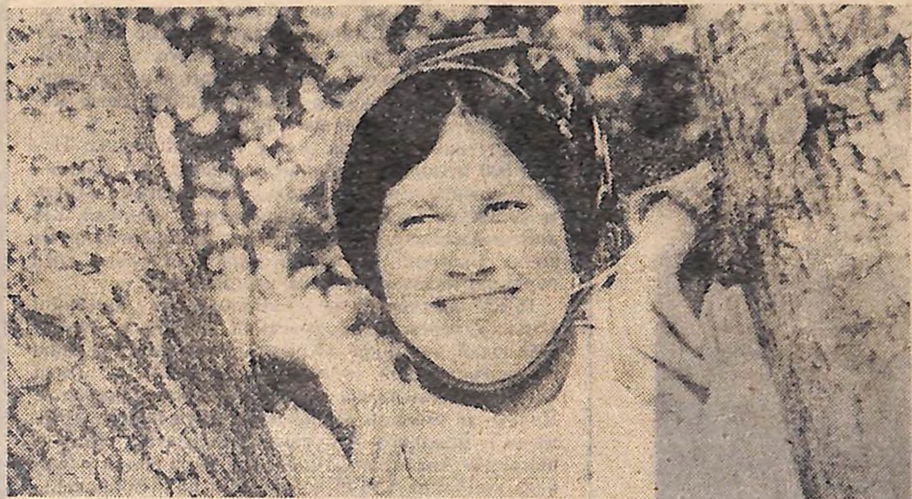
Нова в селі трудовий шлях дояркою в колгоспі імені Пилипа Ігнатовича сільського району. Комсомолка знає, що високих результатів можна добитися лише сумлінною працею.