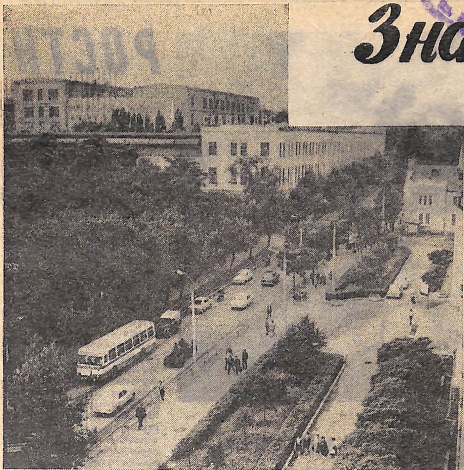
КІРОВОГРАДСЬКИЙ ЗАВОД «ЧЕРВОНА ЗІРКА».