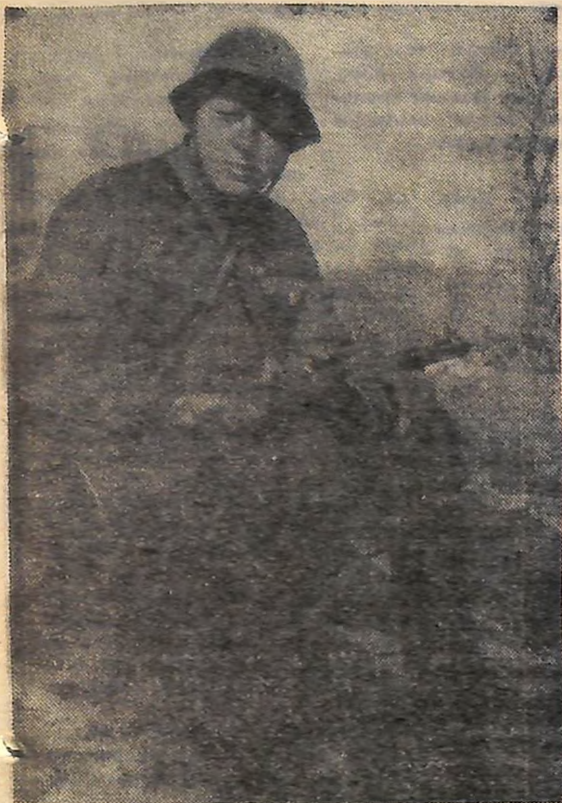
Аркадій Гайдар в роки Великої Вітчизняної війни.

СЬОГОДНІ — 70 РОКІВ З ДНЯ НАРОДЖЕННЯ А. П. ГАЙДАРА