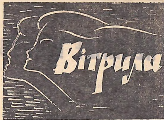
КЛУБ СТАРШОКЛАСНИКІВ. ВИПУСК № 4.

десятикласниці Маловісківської середньої школи № 4.