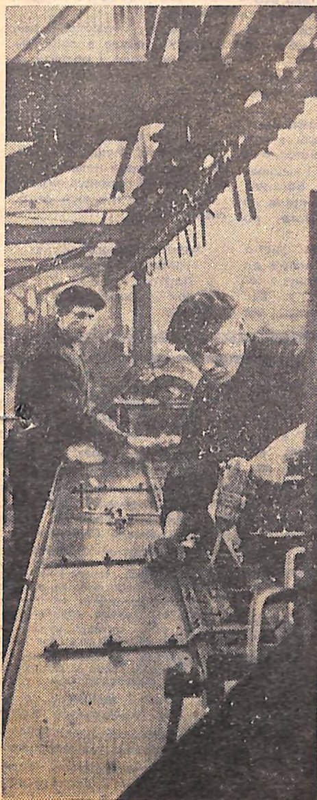
В механоскладальному цеху заводу «Червона зірка».