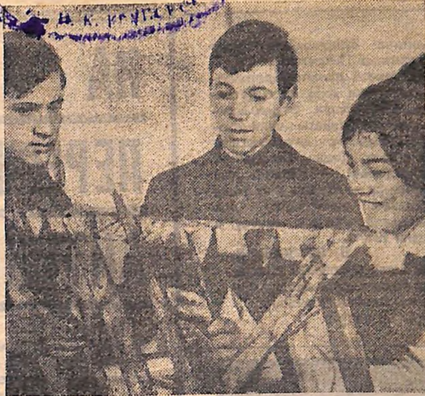
Ще тільки недавно в Панчівській середній школі обговорили звернення комсомольців-земляків Новомиргородщини. А зараз вже новим ходом йде виготовлення шиттів для затримання снігу.

Мітинг на Чепельському комбінаті вилився в яскраву демонстрацію братерської дружби і співробітництва КПРС і УСРП, Радянського Союзу і Угорської Народної Республіки, глибоких зв'язків радянського і угорського народів.