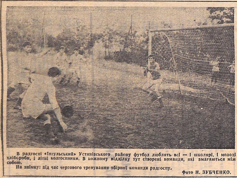
В радгоспі «Інгульський» Устинівського району футбол люблять всі — і школярі, і молоді хлібороби, і літні колгоспники. В кожному відділку тут створені команди, які змагаються між собою. На знімку: під час чергового тренування збірної команди радгоспу.