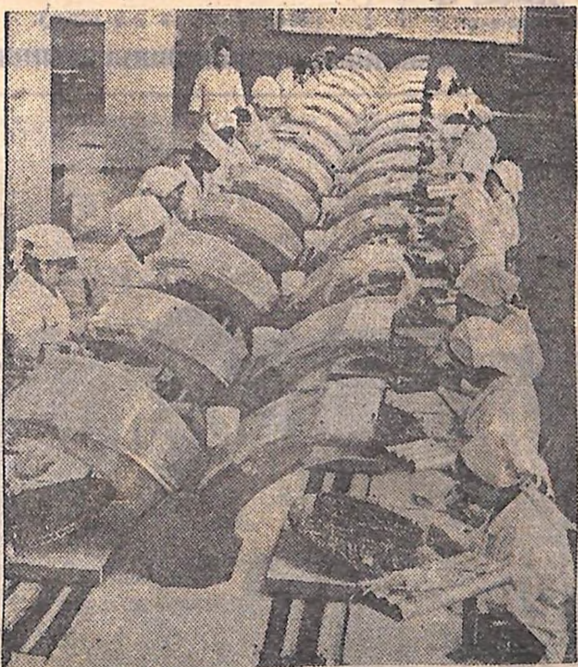
Магнітофони «Комета» Новосибірського заводу точного машинобудування користуються великим попитом радянських покупців. Вони красиві, зручні в користуванні, мають відмінні акустичні дані. На знімку: конвеєр складання магнітофонів «Комета» МГ-209 на Новосибірському заводі точного машинобудування.

Пленум заповняє ЦК КПРС, ЦК КП України, ЦК ВЛКСМ, що комсомольці, юнаки і дівчата республіки віддають усі свої сили, знання і вміння на успішне виконання рішень XXIV з'їзду КПРС, XXIV з'їзду КП України, внесуть вагомий вклад у справу побудови комунізму.