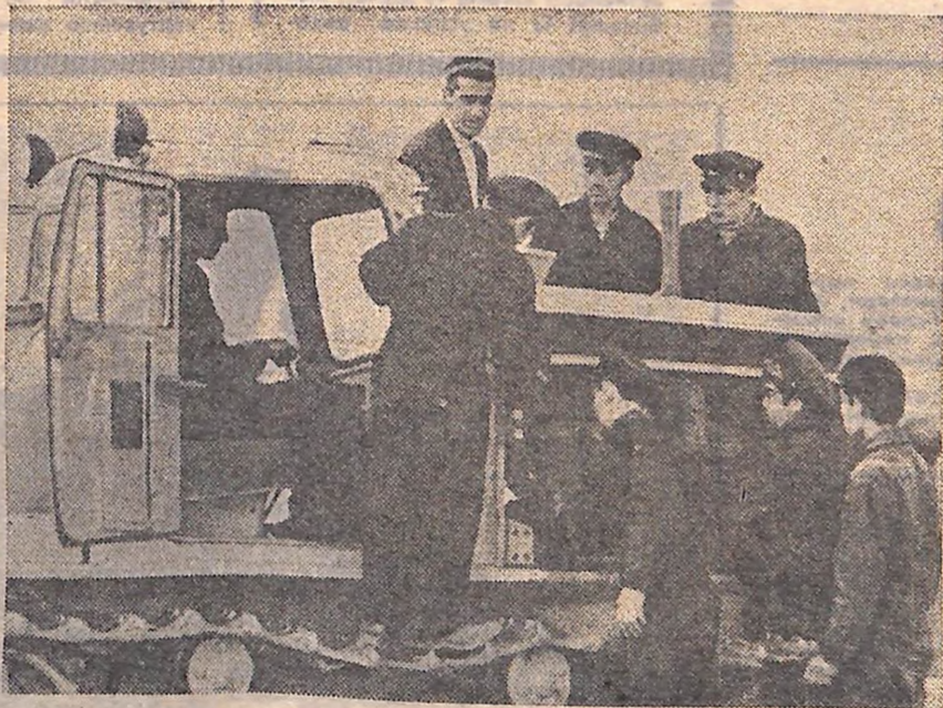
Сільських механізаторів широкого профілю готує професійно-технічне училище № 11 в селищі Чептура Радянського Таджикистану.