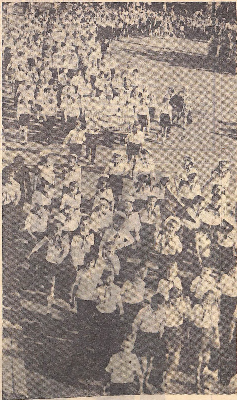
До пам'ятника В. І. Леніну з квітами.