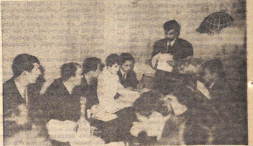
Іде засідання клубу.