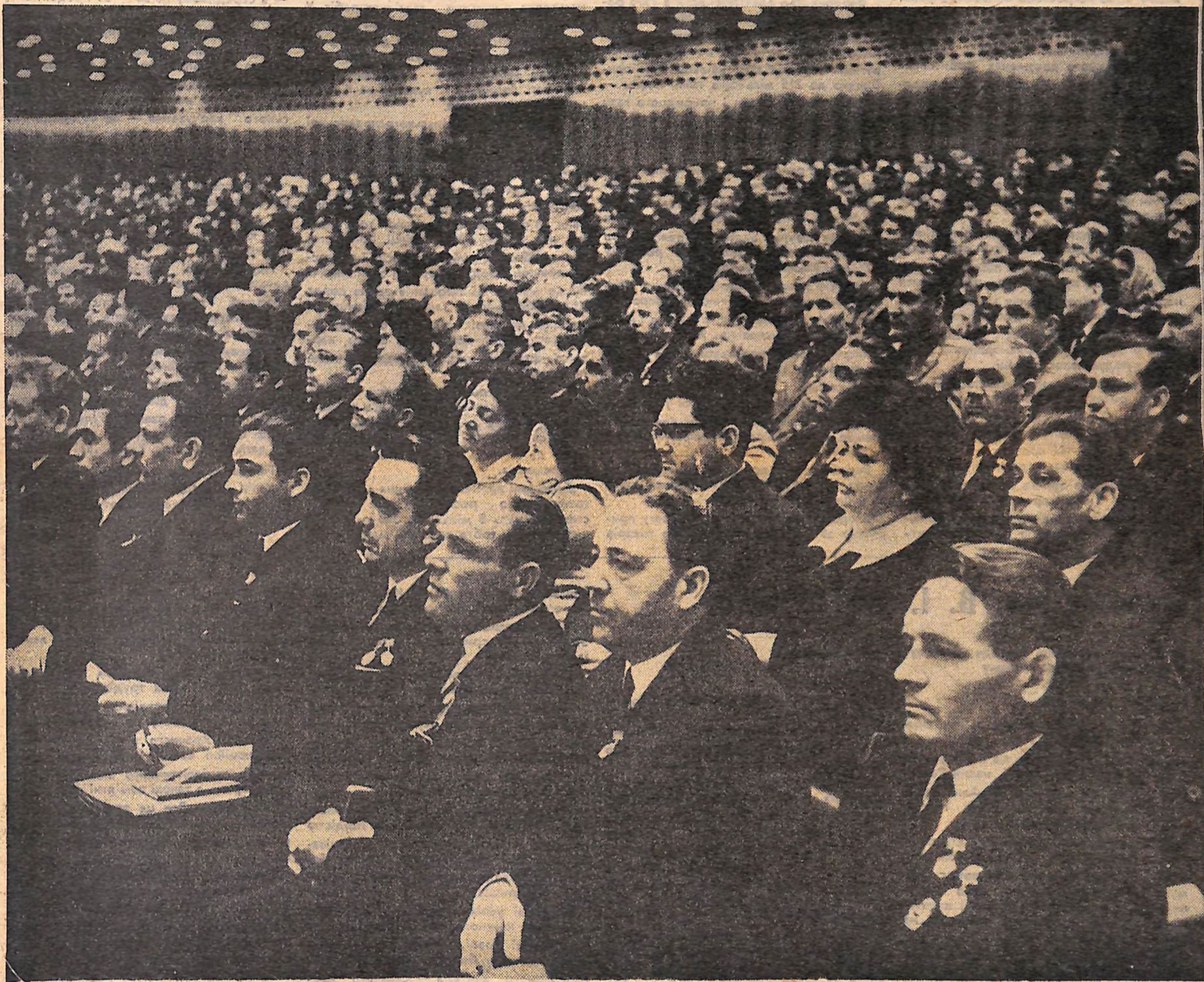
В залі засідань з'їзду. На передньому плані — делегація від Кіровоградської обласної партійної організації.