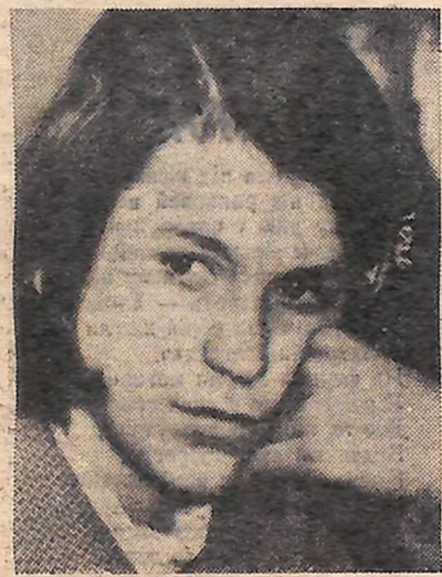
Їй подобаються вірші студійців...