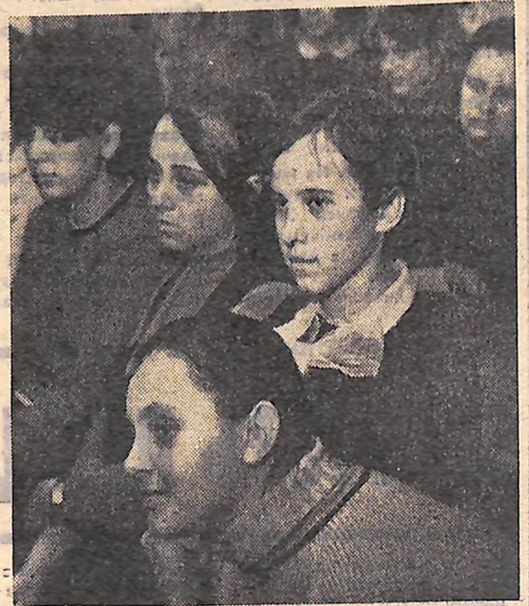
„Сівачі“ звітує перед ровесниками.