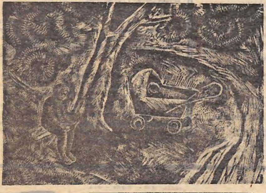
На фото: дві ліногравюри із циклу «Щасливе материнство».