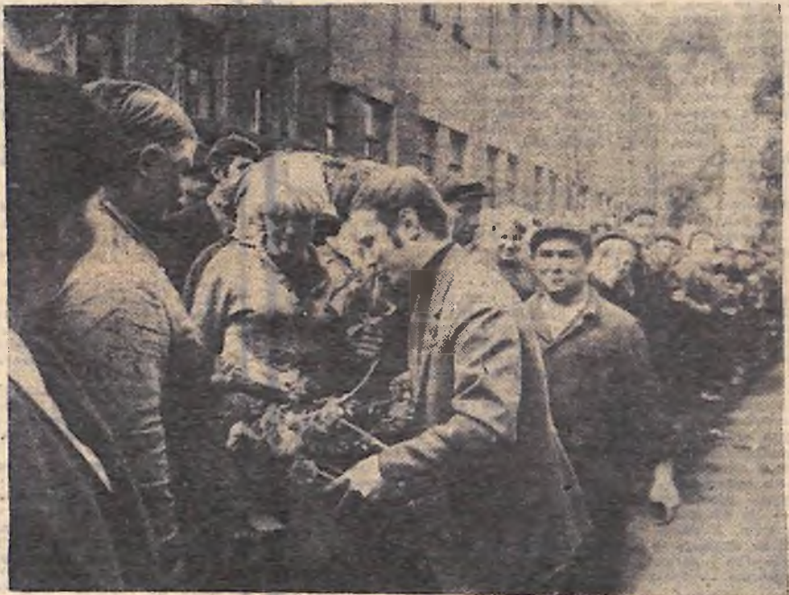
На фото: вгорі — чехословацька делегація на заводі «Червона зірка», внизу — з колективом перед червонозорівцями виступає ансамбль пісні і танцю «Олшава».