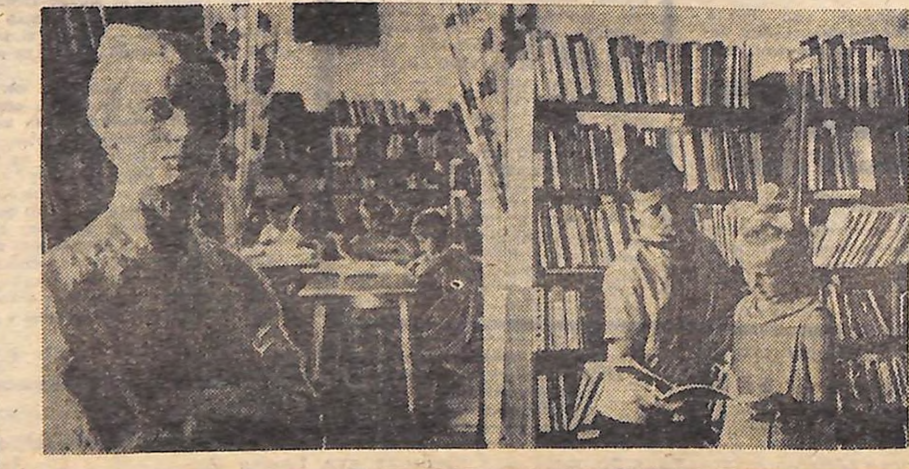
Свято шанують новоукраїнці пам'ять про першого секретаря райкому комсо- молу Ваню Демченка, який загинув у боротьбі за владу Рад. Його ім'я при- своєно одній з вулиць міста, бібліотеці для дітей та клубу. На фото: в бібліотеці Імени Вані Дем- ченка. На передньому плані — бос В. Демченка.

Не вшухали оплески і піс- ля виступу співака Алім- джана Ісмаїлова.