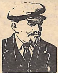
До 100-річчя від дня народження В. І. Леніна

Познайомимося з деякими з цих листів, що стали справжніми документами епохи.