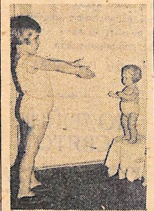
Ми разом робимо зарядку.