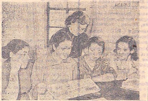
Ваньку своєю привітністю й зацікавленістю кутком на молочно-товарній фермі колгоспу імені Леніна, Олександрійського району.

О. КУДРЯВЦЕВ, член лекторської групи обкому комсомолу.