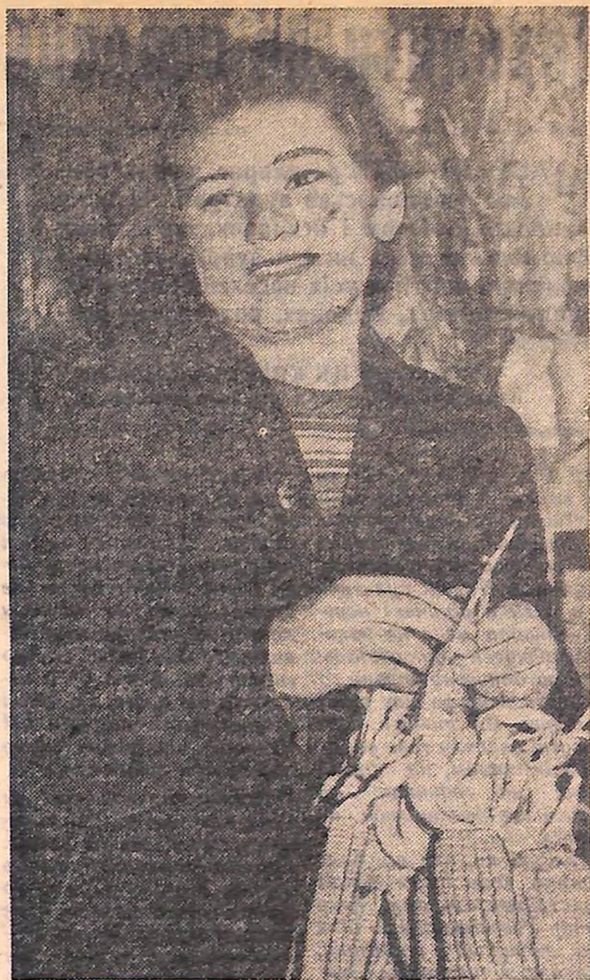
Ц ІКАВУ і змістовну роботу проводять на своєму полі члени шкільної виробничої бригади Красносільської середньої школи, Олександрівського району. Вони на практиці застосовують найновіші досягнення агротехнічної науки.

Про досвід роботи і успіхи учнівських навчально-виробничих бригад читайте на 3-й стор.