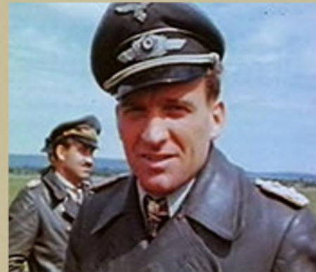
Пілот Люфтваффе Ганс Ульріх Рудель

«Мене ця звістка буквально зірвала з місця. На безхмарному небі світять зірки. Я вирішив поговорити з втікачами сам. Малі Віскі (Мала Виска) всього в 30 кілометрах на північ, кілька підрозділів люфтваффе зі своїми літаками розміщені на цьому аеродромі.- Ми можемо тільки сказати, що коли спали, то почули раптовий гуркіт, а потім побачили, що повз нас йдуть російські танки з піхотою на броні. Інші пілоти говорили про напад танків на аеродром. Все сталося дуже швидко, льотчики були захоплені зненацька, на них були лише піжами. Я намагався оцінити ситуацію і прийшов до висновку, що летіти туди безглуздо, оскільки для того, щоб потрапити в танк, треба його добре бачити. Ясно, що зоряного неба для цього недостатньо. Доведеться дочекатися ранку».