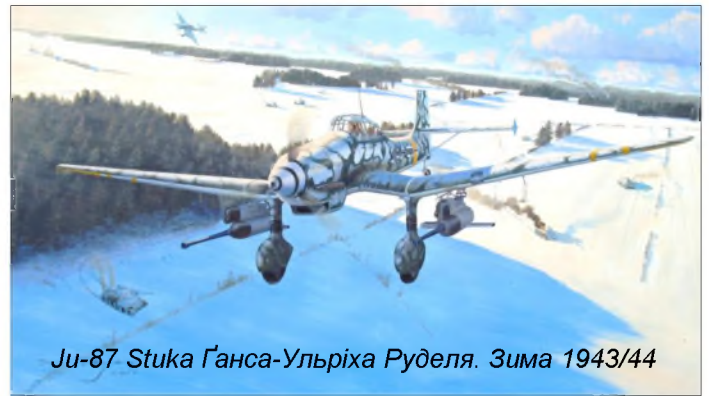
Ju-87 Stuka Ганса-Ульріха Руделя. Зима 1943/44

12.01.1944 корпус все ще намагався тримати район переправ. О 8.00 радянські війська вибили ворожі сили з радгоспу Петровського. О 9.00 до району Мар'янівки дійшла колона з пальним та боеприпасами у супроводі 6 танків. Також командир корпусу просив прискорити просування уперед радянської піхоти до Мар'янівки аби остаточно закріпити за радянськими частинами переправи через р. Велика Вись. До 17.45 по району зосередження корпусу вела методичний вогонь ворожа