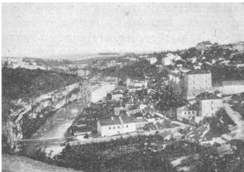
Вид Каменца с восточной стороны

разнообразия путешествие. По сторонам открываются виды Подолии, мелькают селения, барские усадьбы, окруженные парками и ведущими к ним от проезжей дороги аллеями из пирамидальных тополей. При настоящем расписании движения поездов, приезжая в Проскуров ут-