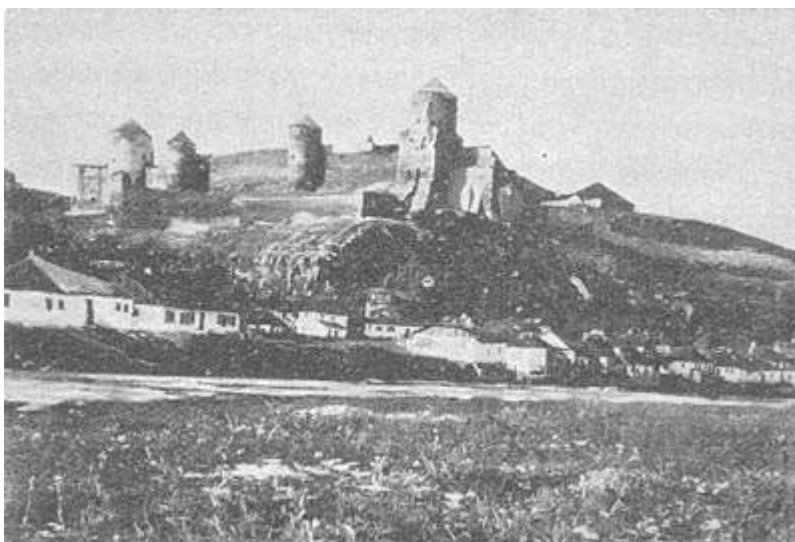
Г. Каменец-Подольский. Турецкая крепость.

не могли разъехаться. Не доходя ворот замка, находится слева вход в погреб, о котором народное предание утверждает, что это — начало подземного хода, соединявшего между собою каменецкую и хотинскую крепости. Напротив этого подземелья, на углу замковой ограды, справа, находится четырехугольная башня, тремя своими сторонами выходящая наружу. Со стороны до-