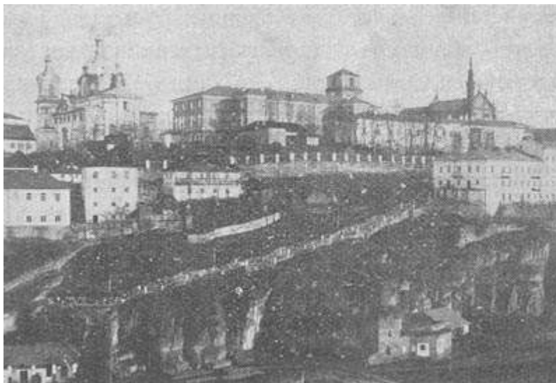
Г. Каменец-Подольский. Кафедральный собор и гимназия.

Как Польская брама оберегала въезд в город с северной стороны, так Русская брама защищала южный городской въезд. Представляя собою также как бы отдельную крепость, она состояла из четырех бастионов, соединенных между собою строениями. Две башни были по-