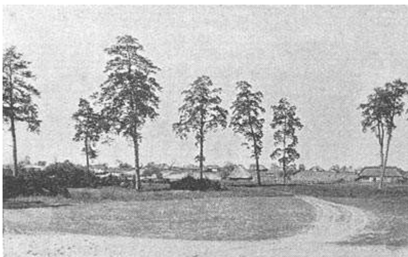
Вид в окрестности ст. Деражни.

русских областей к России, вместе с другими именами Чарторыйских было конфисковано и состояло в ведении казны до 1795 года, когда по указу Императрицы Екатерины II был возвращен князьям Чарторыйским. Однако, когда возник мятеж 1830 года, в котором принял деятельное участие князь Адам Чарторыйский, то имения его, в том числе и Меджибужье, прави-