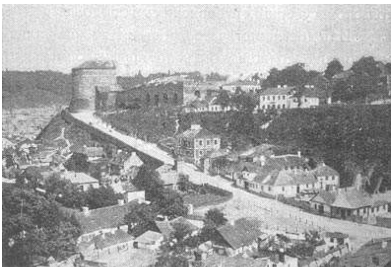
Город Каменец Подольский. Старый въезд в город и башня Батория.

и в начале XVI в. Каменец и его окрестности подверглись набегам татар и турок; город был разорен ханом Айдаром в 1474 году и султаном Махометом II в 1476 г.; в XVII в. Каменец осаждали козаки и турки; так, Хмельницкий осаждал его в 1648 и 1658 гг., а в 1672 году гетман Дорошенко, соединившись с султаном Магометом IV и крымскими татарами,