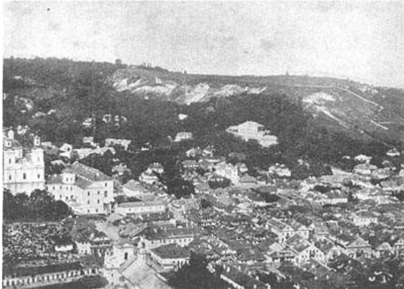
Общий вид г. Кременца.

Виленскому Янушу, который заботился об исправлении и укреплении замка. С 1536 до 1556 года замок находился во владении королевы Боны, жены Сигизмунда. В 1648 году козаки осадили замок и после шестинедельной осады взяли