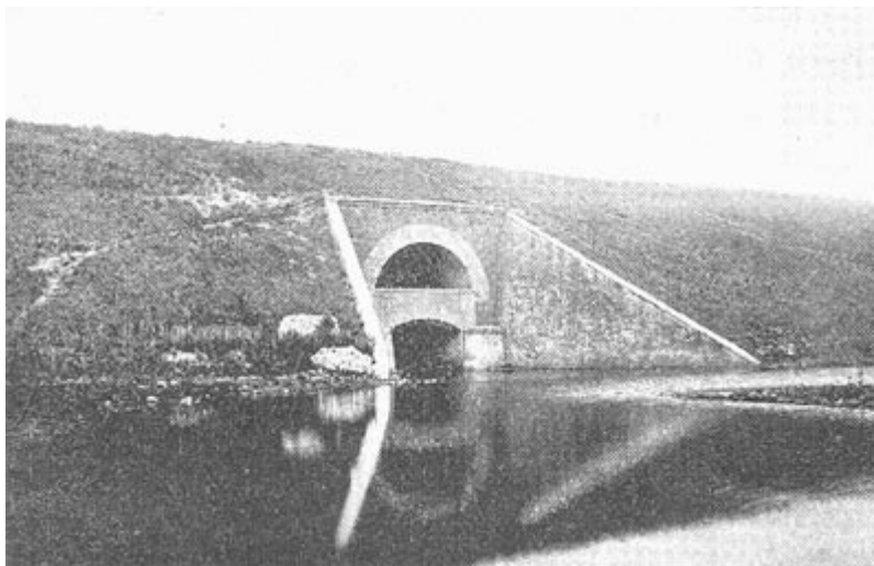
Труба на Кучурганской насыпи.

типами представителей местного населения имеет захватывающий интерес. Окружающая обстановка далеко не обычна, проносящаяся пред глазами картины новы, но в тоже время кругом слышится русская речь, хотя временами и испорченная, попадаются чисто русские типы и чувствуется, что все это часть России, часть того могучего организма, который наполнил собою половину Европы и Азии, соединил в одно целое и ассимилировал целый ряд племен и народов.