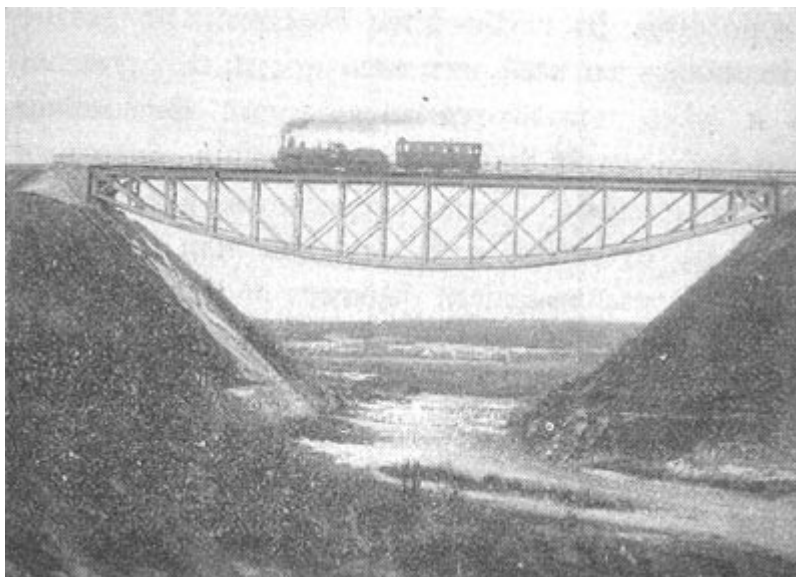
Мост на реке Калфе.

Калфа, окрестности которой представляют из себя широкую безлесную степь, перерезанную невысокими пологими пригорками.